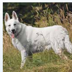
BELLA, Weiße Schweizer Schäferhündin