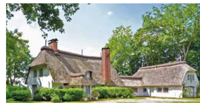
Mit dem Erwerb dieses Reetdach-Anwesens erfüllte sich ein Lebenstraum für die Familie Schnuchel.