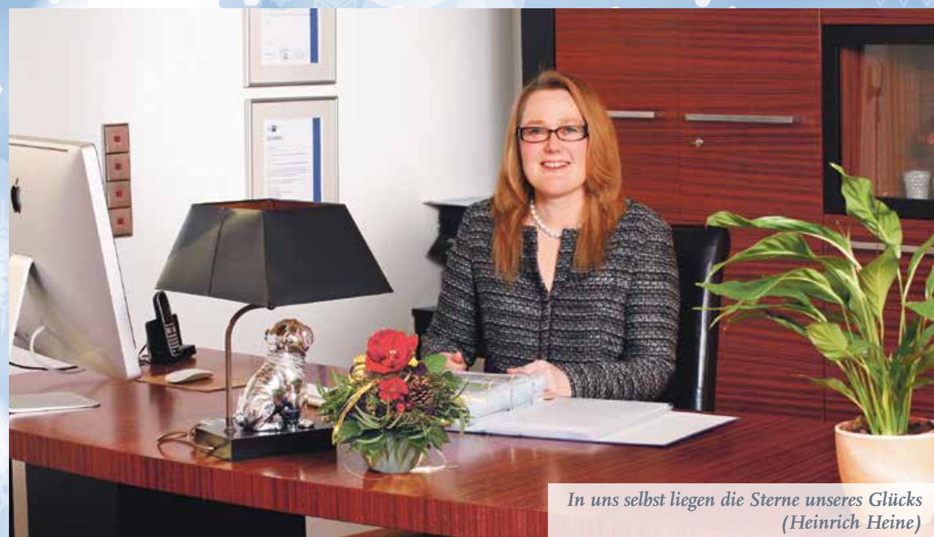
In uns selbst liegen die Sterne unseres Glücks (Heinrich Heine)